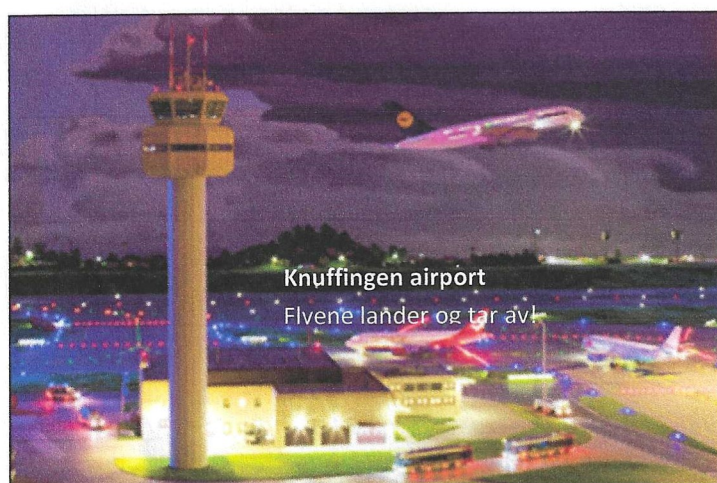
Knuffingen airport Flvene lander og tar av!

Det blir relativt lite kjøring og desto flere opplevelser og god tid til sosialt samvær.